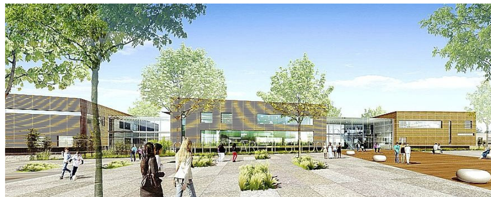
Les travaux ont démarré en février 2014 pour une durée de 21 mois. La fin du chantier est prévue pour novembre 2015.

L'opération de reconstruction du collège s'inscrit donc dans une volonté d'exemplarité du Département en matière d'environnement qui se traduit par une certification HQE (Haute Qualité