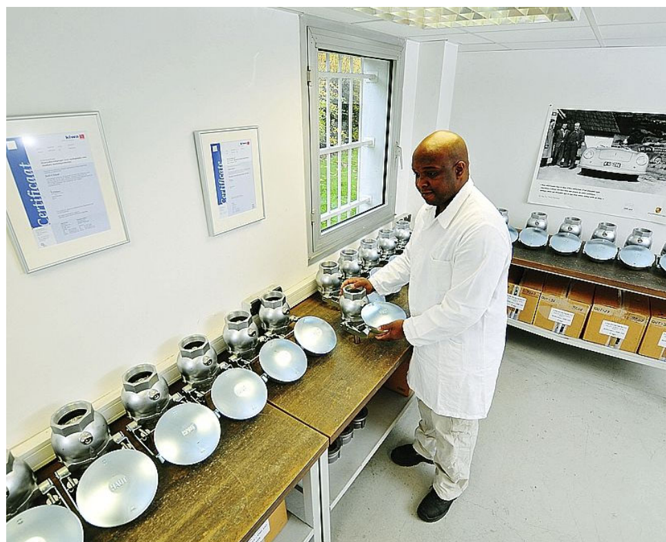
L'entreprise torcéenne compte près de 35 salariés dont 20 ouvriers. Elle est spécialisée dans le chauffage domestique et les équipements techniques des cuves pétrolières.

Nous évoluons dans un petit marché et notre produit