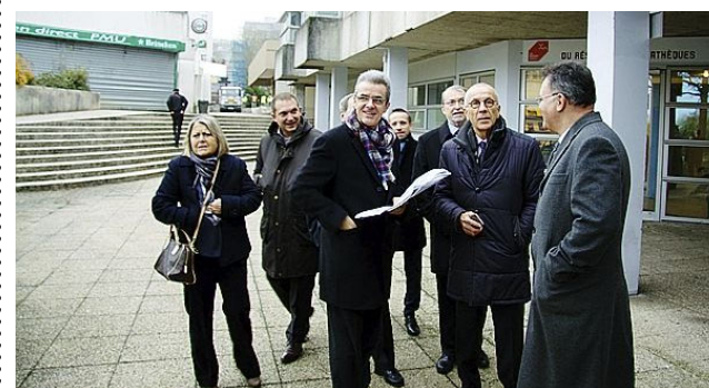
Le préfet a effectué une visite détaillée du secteur.

Trois mois après sa prise de fonction, le nouveau préfet de Seine-et-Marne est venu visiter le Val Maubuée.